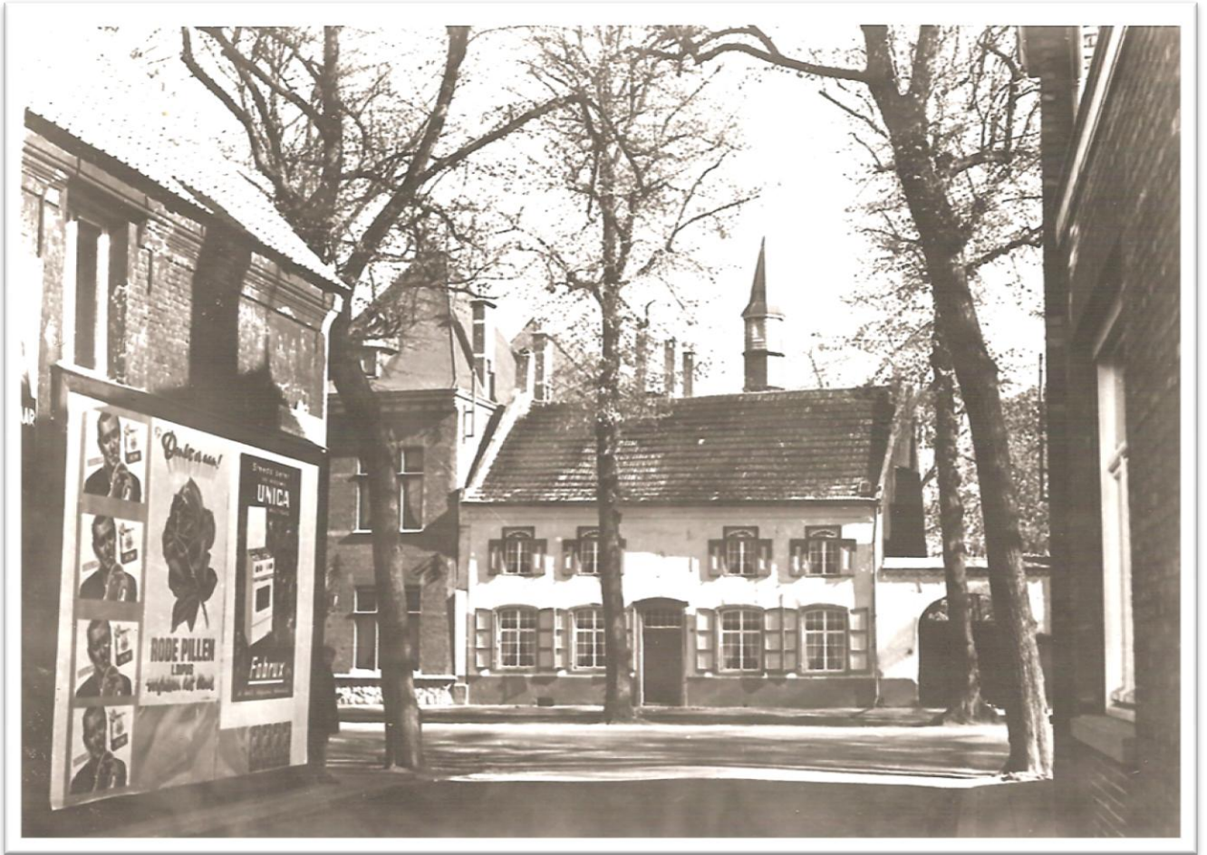
Nog een van die mooie foto's van de vroegere Markt.

De dieptelijnen van de woningen van de Collegestraat focuseren u op dat mooie gevelhuis De Engel (nu Van der Voort Interiors), met op de achtergrond het torentje van 't Gesticht (sorry, van de huidige De Zwaan).