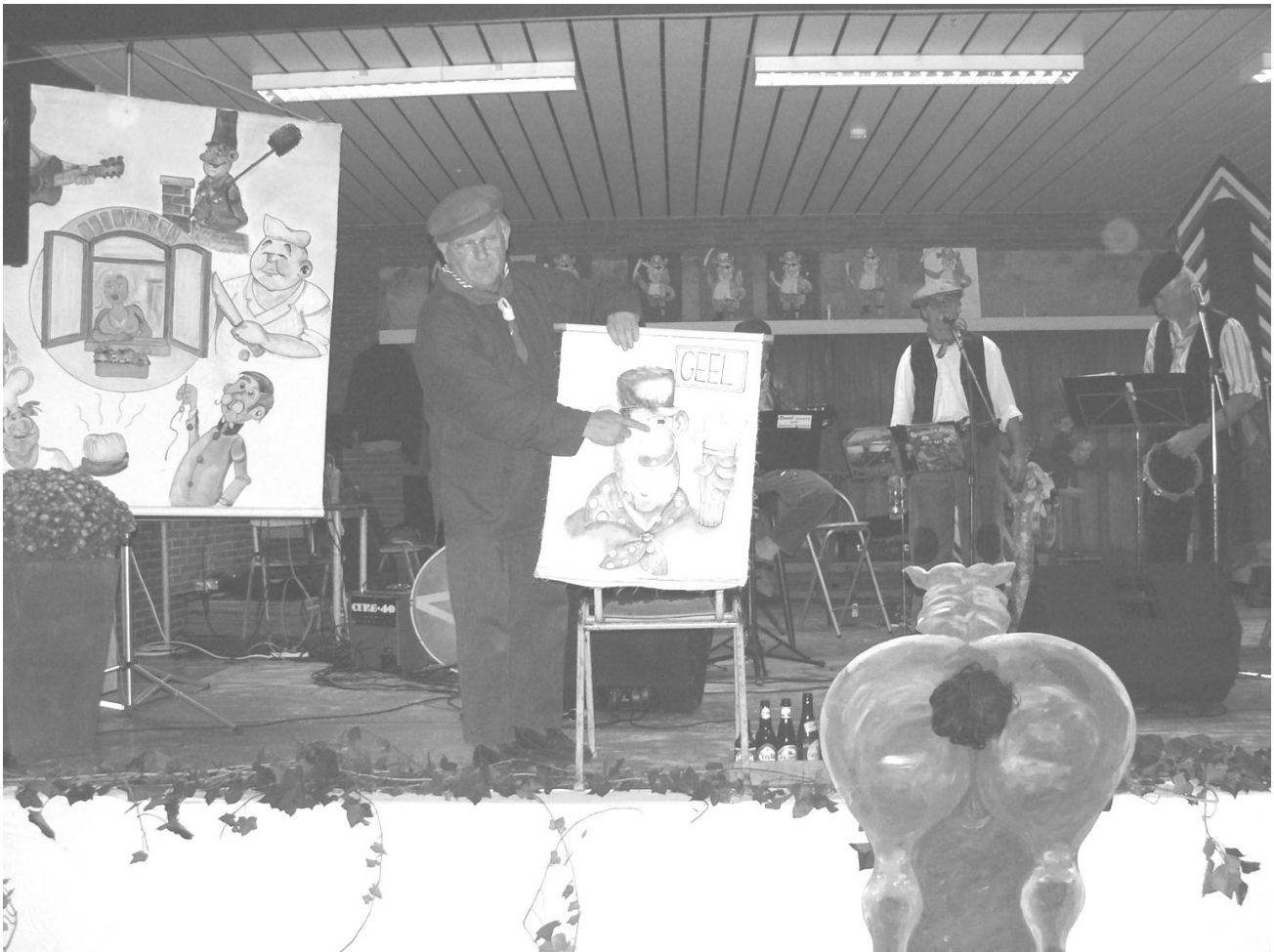
De 'Streusselboeren' in actie!

Het wijkcomité hoopt volgend jaar weer vele senioren te mogen verwelkomen op hun amusante dag op eind oktober.