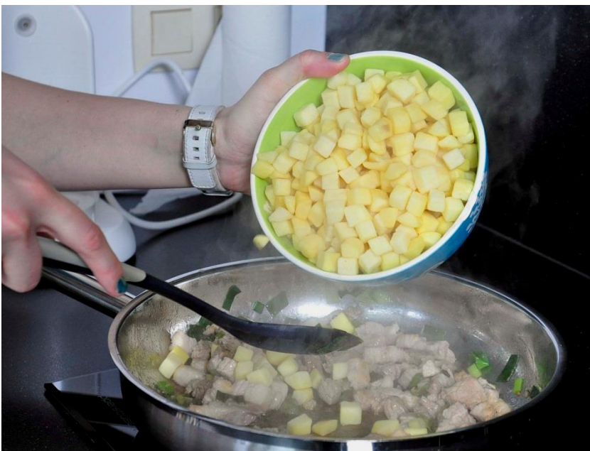
Stap 4 Voeg de aardappelblokjes erbij.