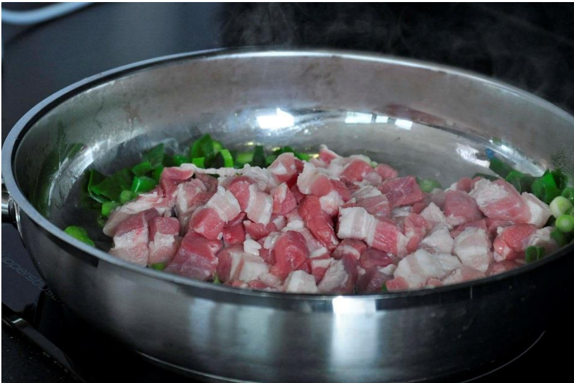
Stap 3 Bak de uiringetjes en de spekblokjes tot de blokjes krokant zijn.