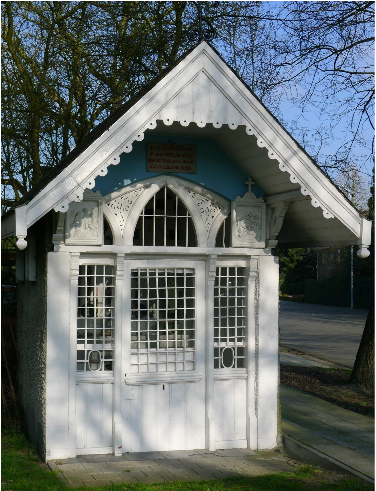
Het kapelletje op het pleintje aan de Martelarenstraat.