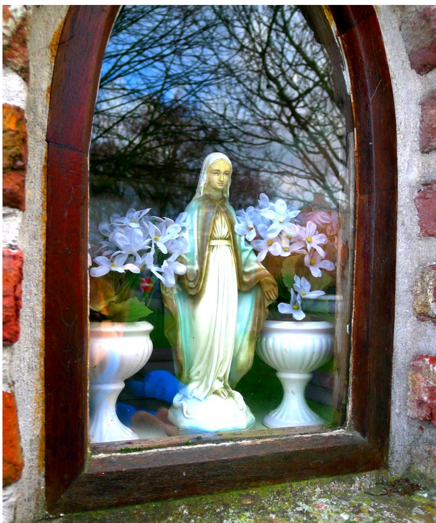
Het Muneskapelletje van de Borgerhoutsendijk.

Ginderbroek is altijd al een wijk geweest met vele Mariakapelletjes en ze telde naast enkele openbare kapellen ook een twintigtal Mariabeelden in nissen en gevels. Waar je ook komt, bijna alle kapelletjes worden op het eind van april mooi opgeblonken en versierd, soms met verse bloemen of met witte en blauwe papieren slingers.