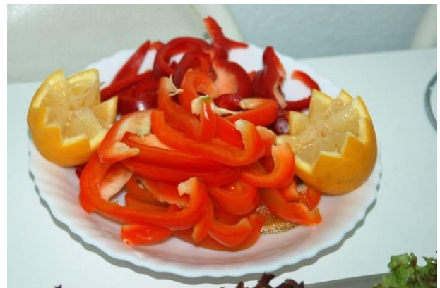
Paprika en citroen