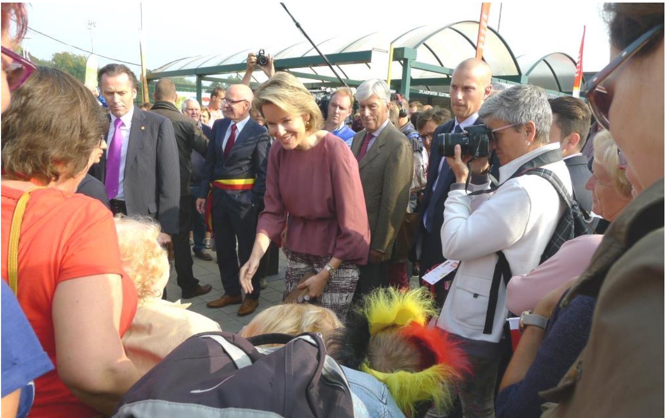
Bij haar aankomst begroette de koningin ook hartelijk een vrouw in een rolstoel.