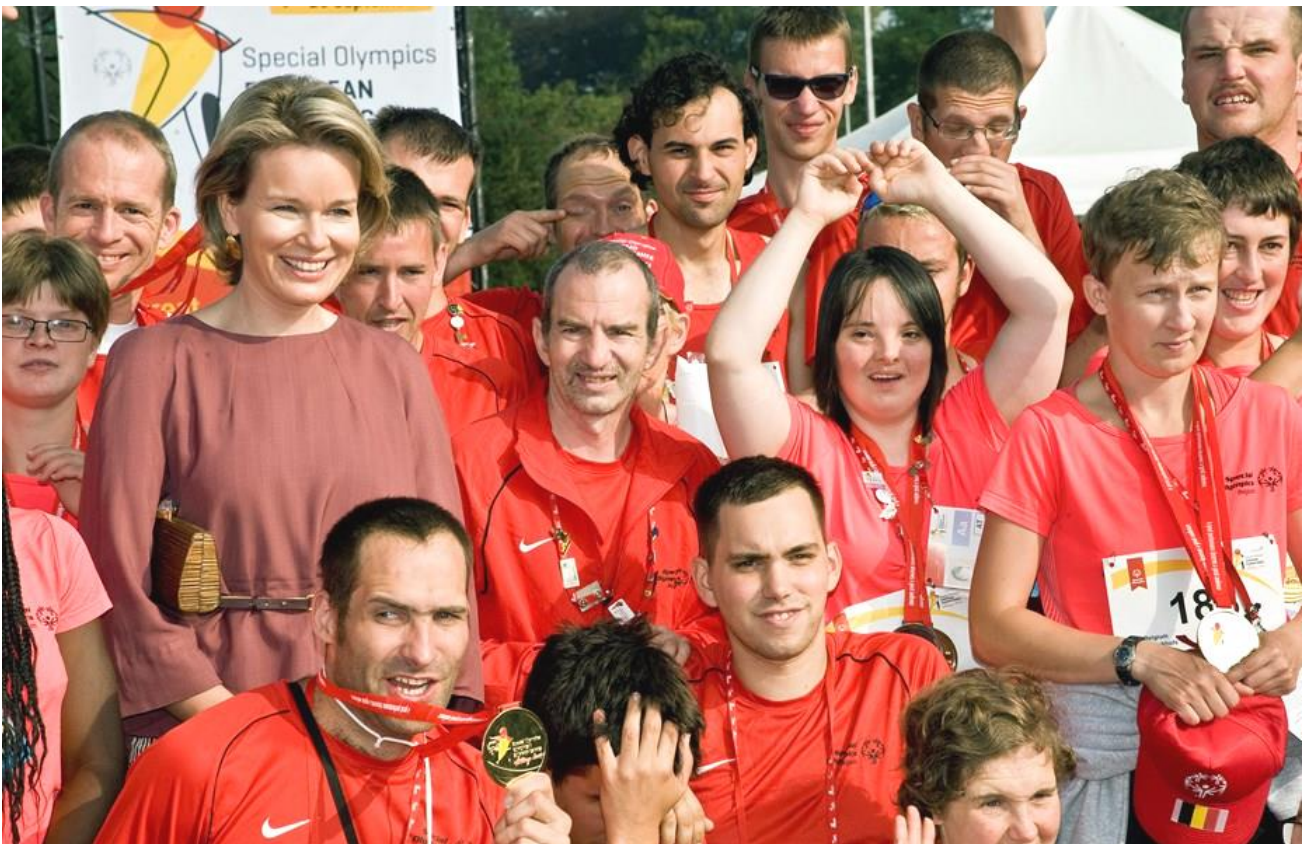
De koningin te midden van de atleten uit heel Europa.