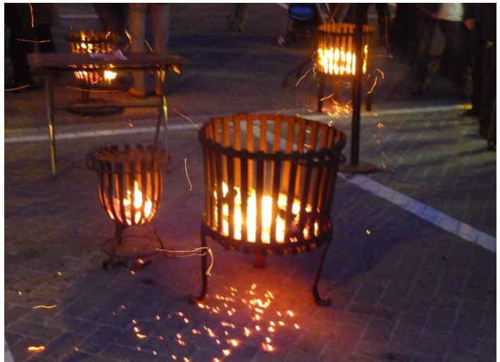
De koolvuren naast het Kersthuis

Maar het belangrijkste is toch wel dat de mensen bij elkaar komen en dat we op het Kerstpleintje de kans krijgen om nog eens te praten met dichte burens en verre kennissen.