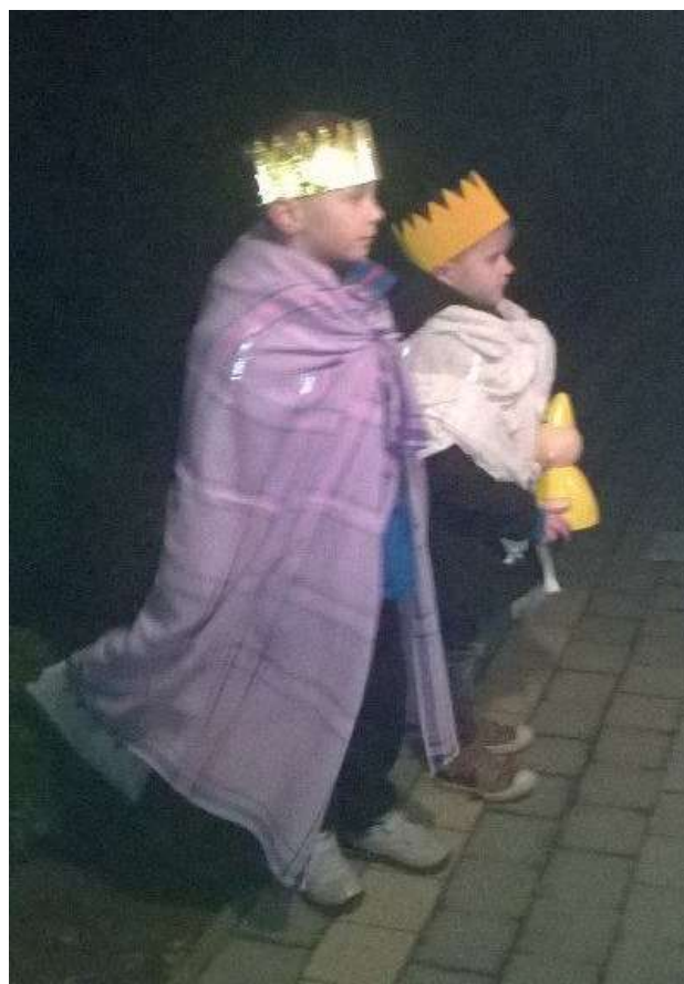
Koningen Warre en Jorbe met echte gouden kronen uit het Peerdskerkhof.