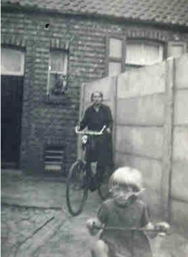
Omstreeks 1940 - De ouderlijke woning van Mathilde De Graaf met een hoge betonnen afsluiting als scheidingsmuur.