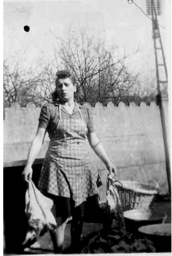
De vrouw des huizes in een veilige tuin met een gebekte stichel.