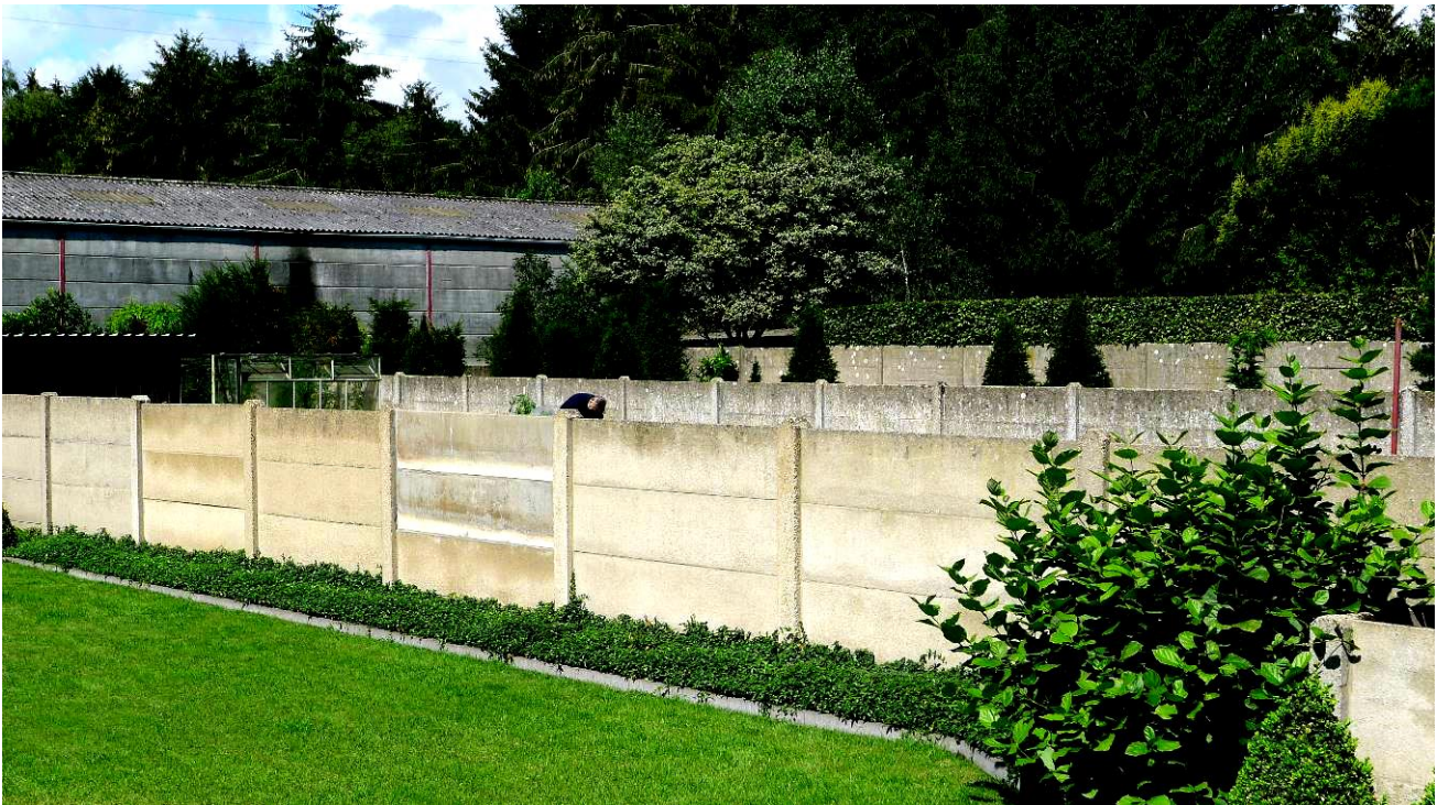
De lange tuinen in de Oude Molenstraat liggen er rustig bij tussen de betonnen stichels.