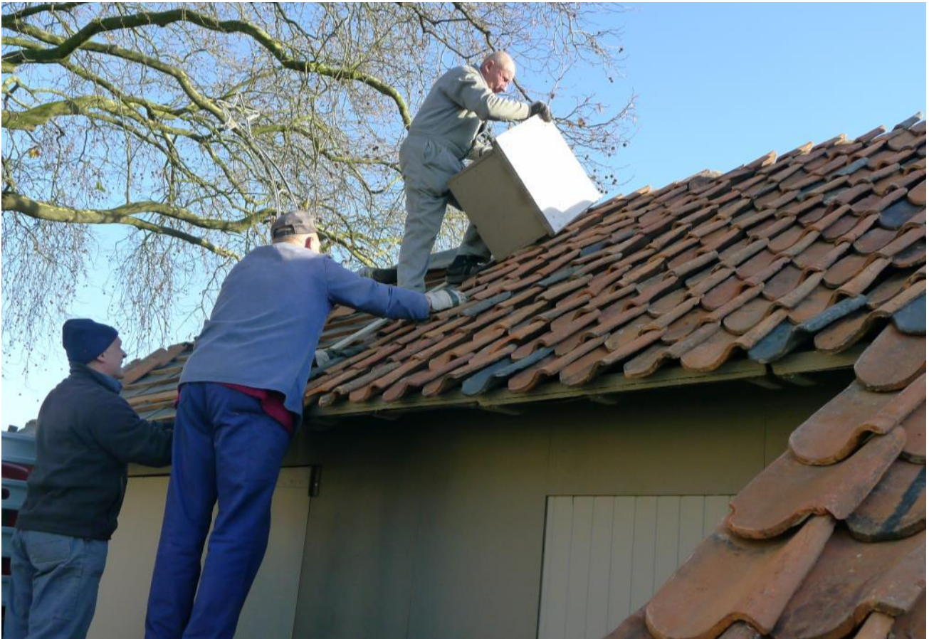
Opbouw Kersthuis 2015

Het Pleintje dat in het centrum van de wijk ligt, krijgt in december een ware gedaanteverwisseling en wordt dan omgetoverd tot het mooiste Kerstpleintje uit de omtrek.