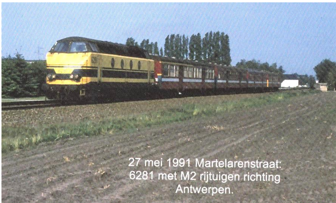
27 mei 1991 Martelarenstraat, richting Antwerpen

In die fotoboeken 'Het station van Mol' staan enkele foto's van de spoorwegovergang aan de Martelarenstraat.