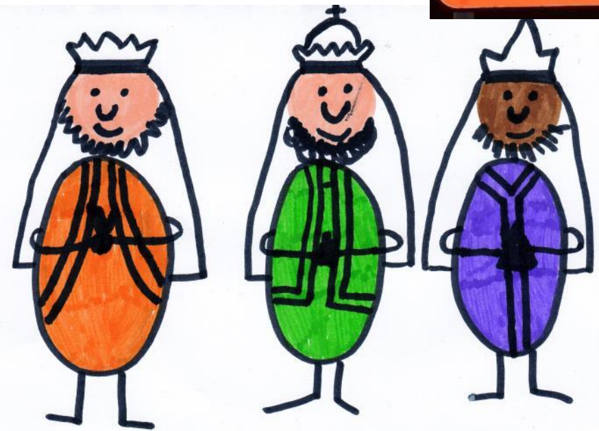
De Driekoningen, Artuur, Beemdenstraat

In de kalender van het Rijpadschooltje lezen we: