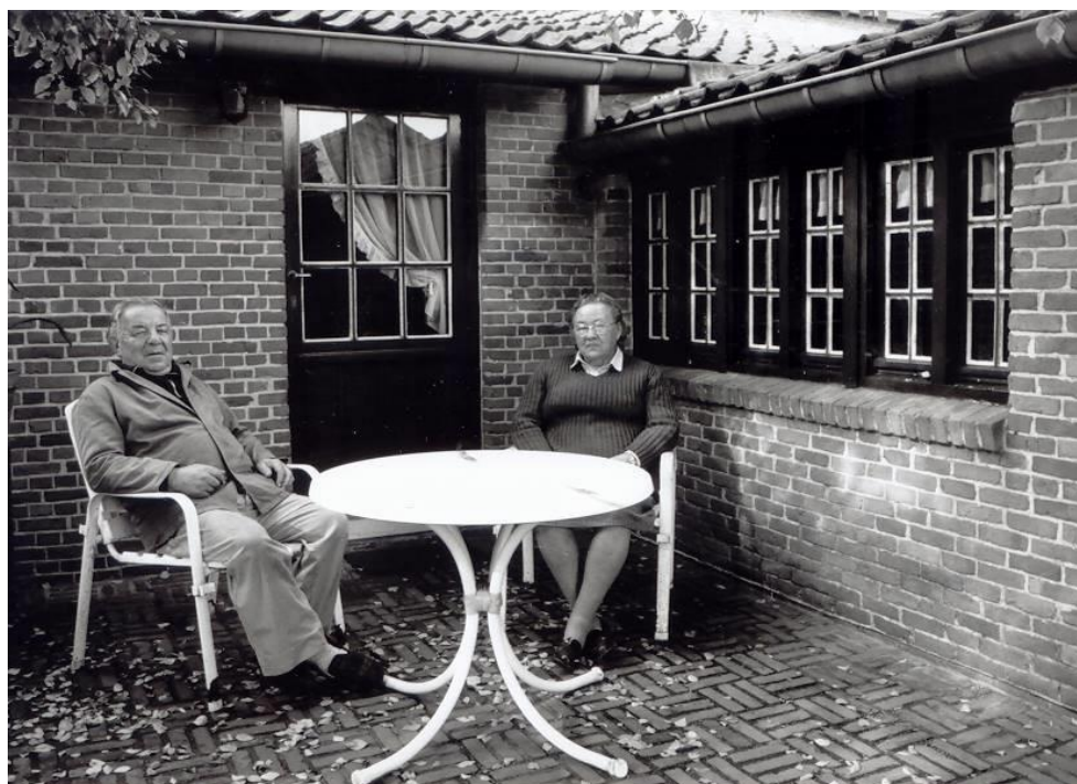
Een welverdiende rustpauze op het gerestaureerde koertje

Het Hooghuis stond alweer aan het begin van een nieuw leven en zal daardoor nog jarenlang het etiket 'een van de oudste bewoonde huizen van het land' genoemd worden.