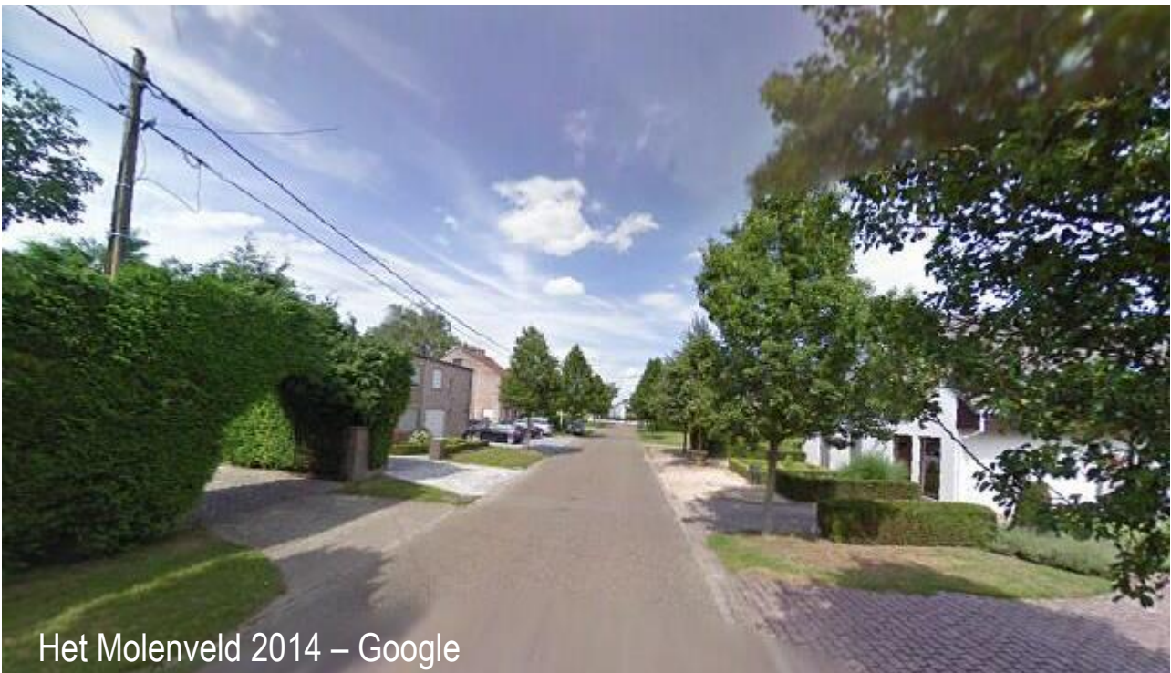
Het Molenveld 2014

1996 – Onderaan de Martelarenstraat, daarop uitkomend het Molenveld, daarachter de Rijpad en de Ruitersstraat en rechts het Chirolokaal. In dat jaar was er nog geen sprake van de Tiendenstraat. Wel zien we het open veld waarop het woonerf met een twintigtal woningen zal komen.