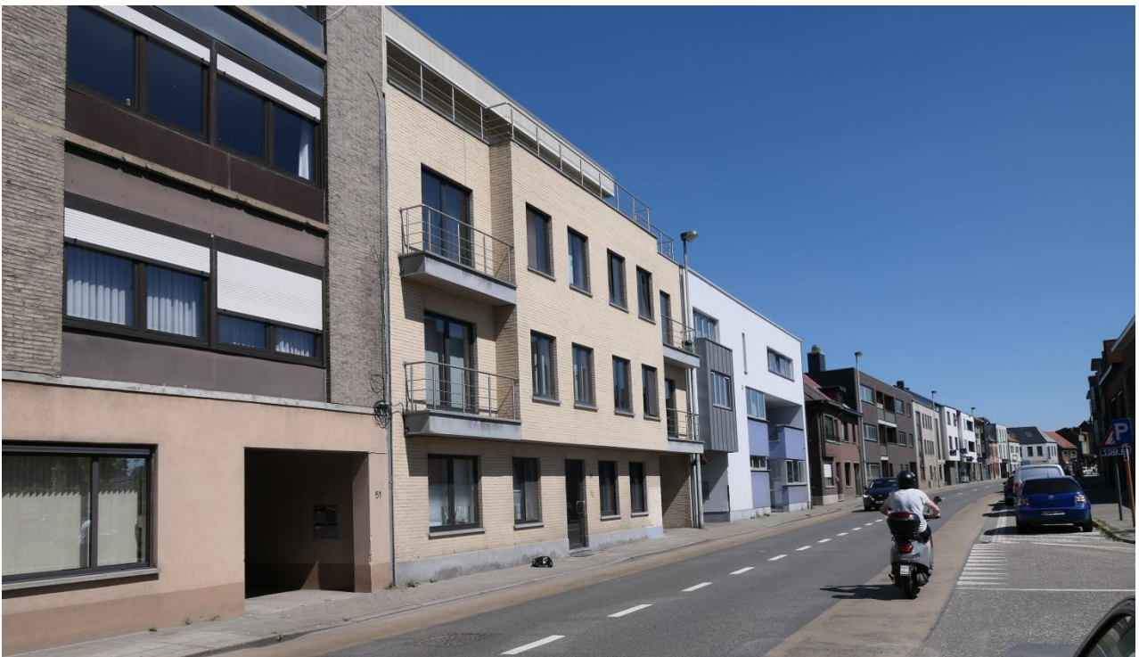
De huidige Nieuwstraat: een corridor van hoge voorgevels