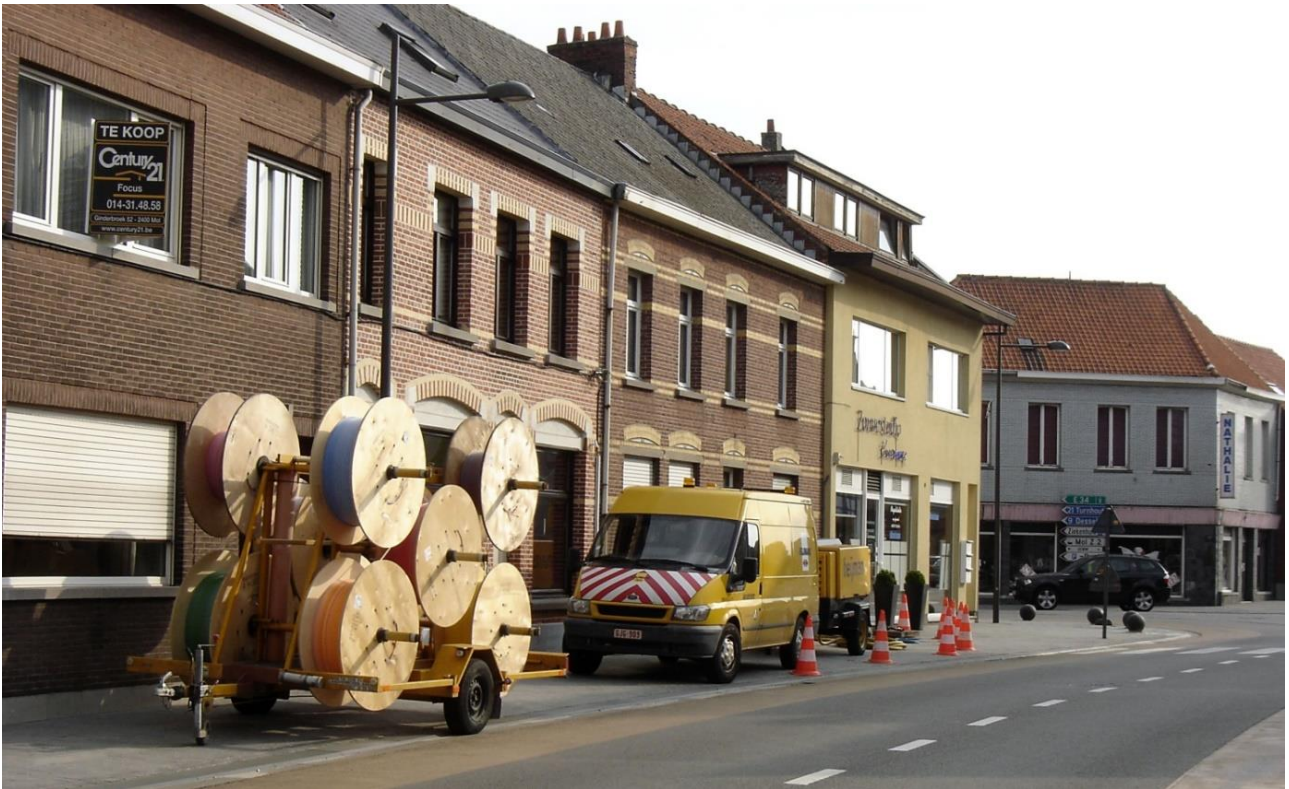
Dit zijn de woningen die in de tweede helft van de 20 ste eeuw gebouwd zijn: huizen met een verdieping.