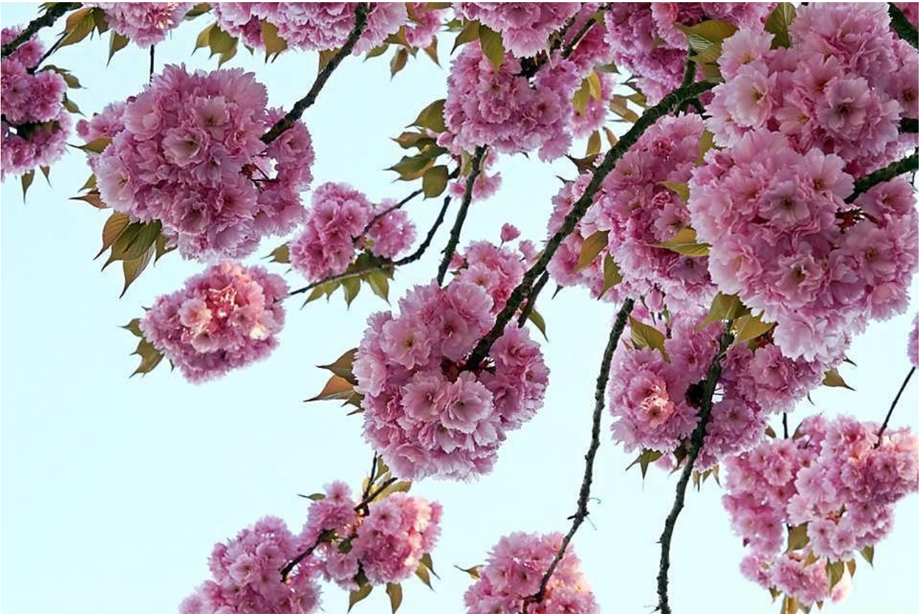
Daar waren ze weer, die mooie bloesems van de Ruitersstraat