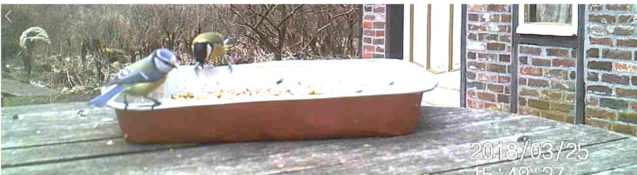
Koolmees en een pimpelmees