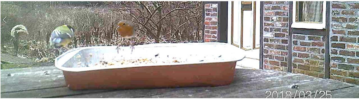
Koolmees en een roodborstje