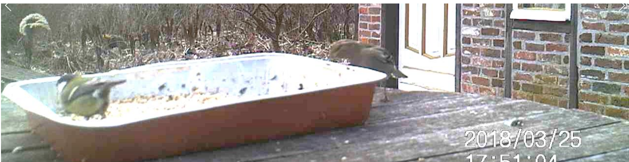
Koolmees en een vink