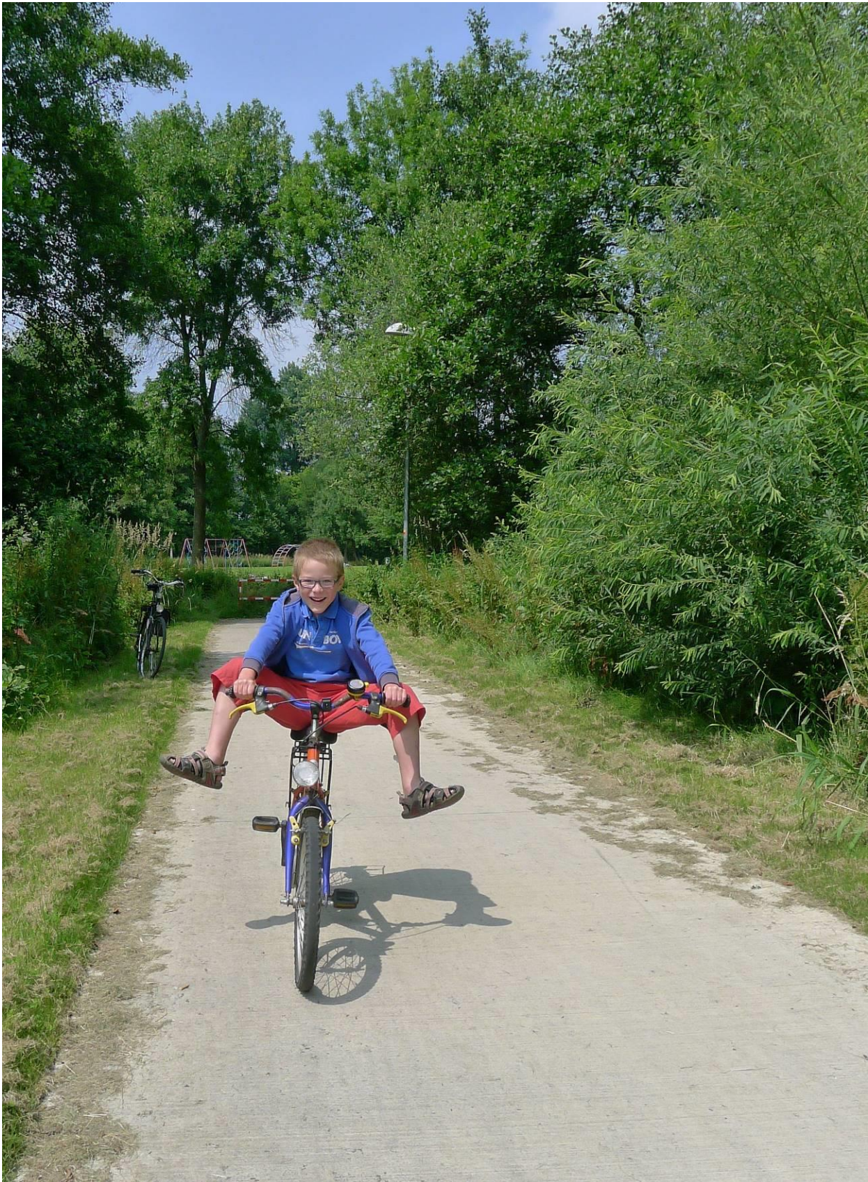
Het betonnen Heipaadje, een fietsterrein voor jolige knapen. Op de achtergrond de Oude Nete (rood-witte nadarafsluiting) en de lig- en speelweide van het openlucht zwembad.