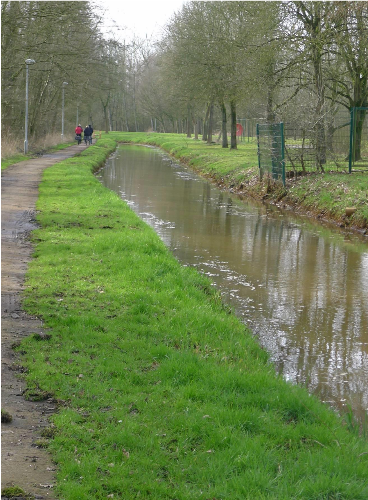
Het Heipaadje langs de Oude Nete en de ligweide van het sportcomplex Den Uyt