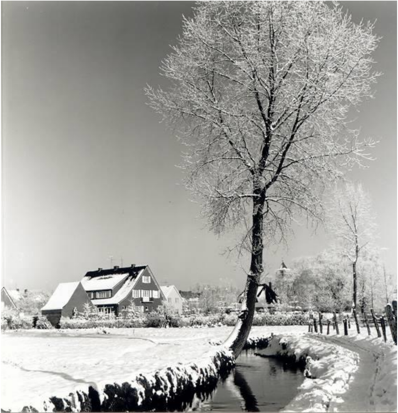
Het vroegere Heipaadje langs de Molse Nete (nu de ligweide van het sportcomplex Den Uyt), richting Rode Kruislaan en met op de achtergrond de kerktoren.