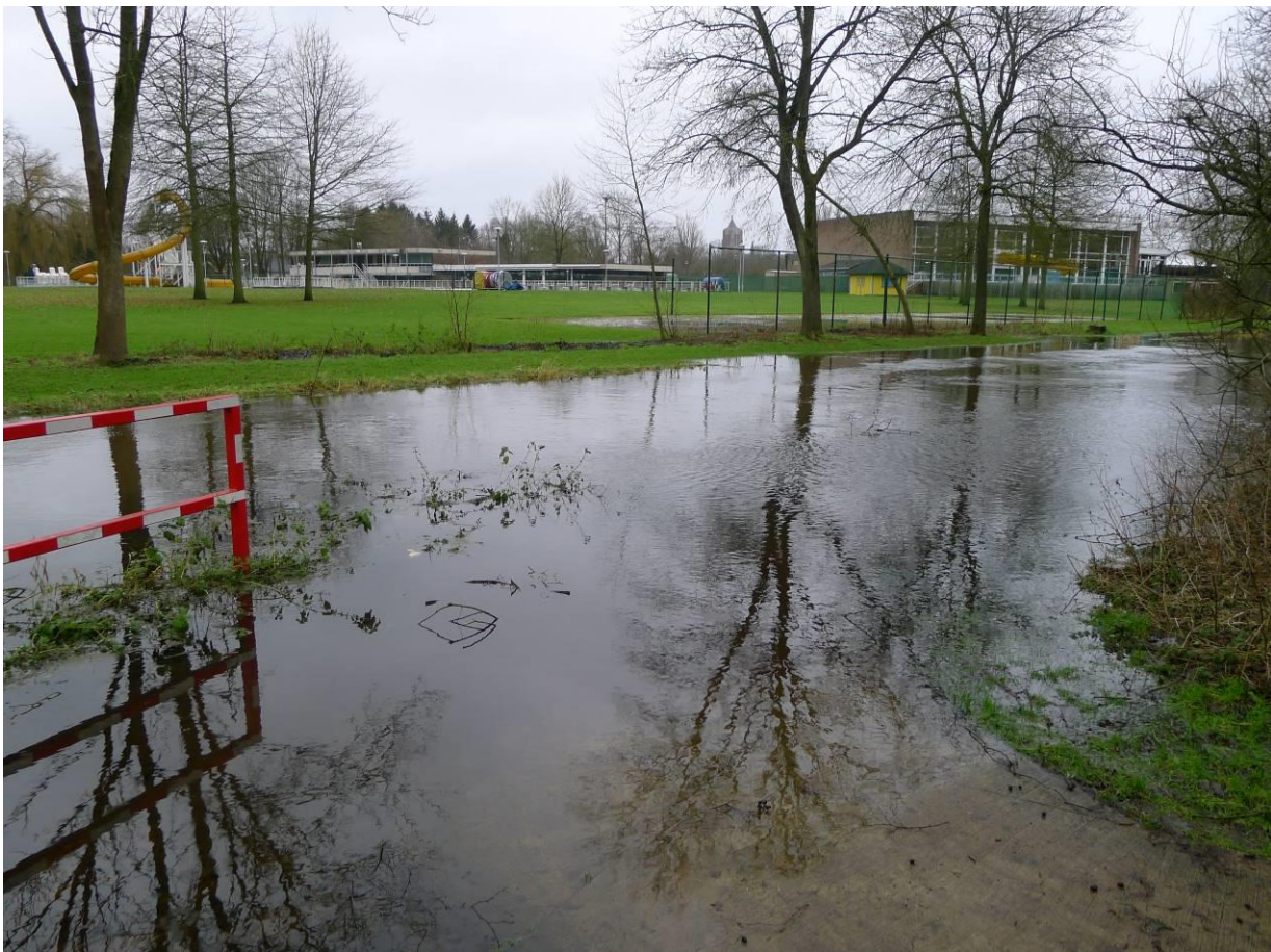
Januari 2015 - Door de hevige regenval van de laatste week dook het Heipaadje achter het zwembadcomplex in volle vaart de overgelopen Oude Nete in.