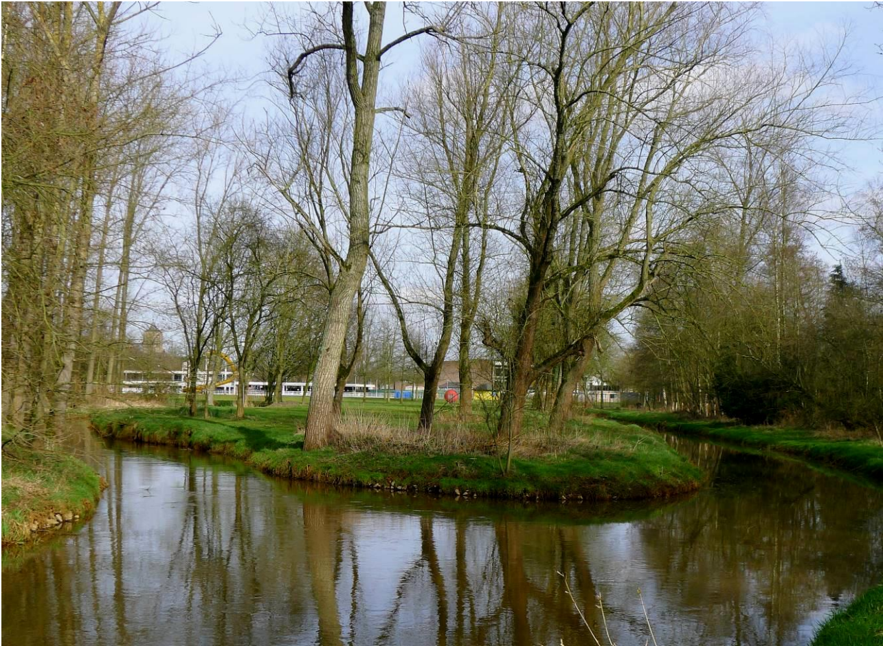
De samenvloeiing van de Molse en de Oude Nete, achter de wijk Ginderbroek.