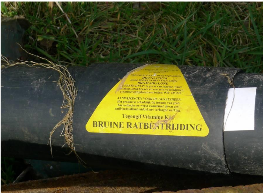
De rattenbestrijding op de oevers van de Nete.