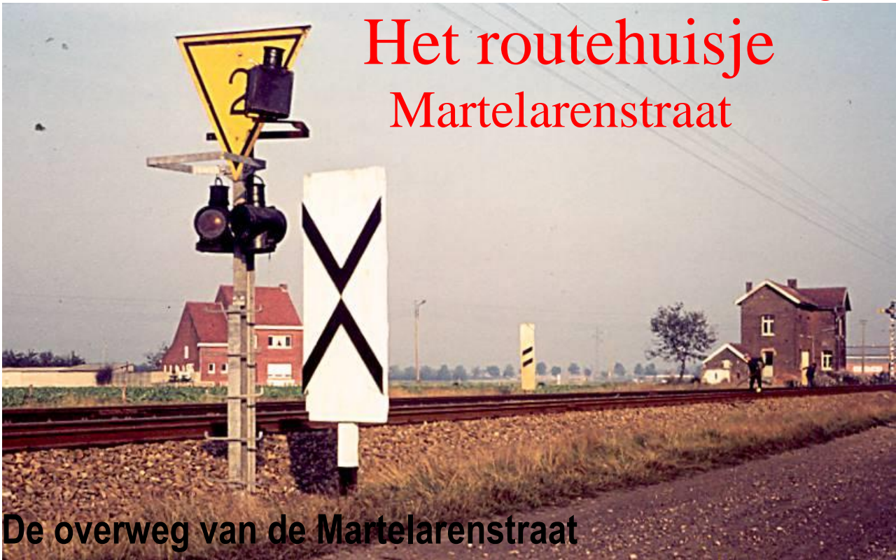
De overweg van de Martelarenstraat

In 1855 werd het treinspoor tussen Turnhout en Antwerpen aangelegd. Pas twintig jaar later werd in mei 1878 Herentals-Mol ingehuldigd en het jaar daarop de verbinding met Neerpelt doorgetrokken. Door de aanleg van de spoorlijn door onze gemeente werd het Mols Veld, toen een onbebouwde landbouwvlakte in tweeën gesneden. Het aantal overgangen werd erg beperkt. Voor het hele Mols Veld werden alle karsporen en servituten onderbroken. Alleen die van de Turnhoutsebaan, die naar Achterbos (Sint-Apolloniaalaan) en die van de Veldstraat (Martelarenstraat) naar Millegem bleven over. In het begin was er als signalisatie eerst niets voorzien. De aanstormende stoomlocomotief kondigde al van op grote afstand zijn komst aan door een snerpend geluid.