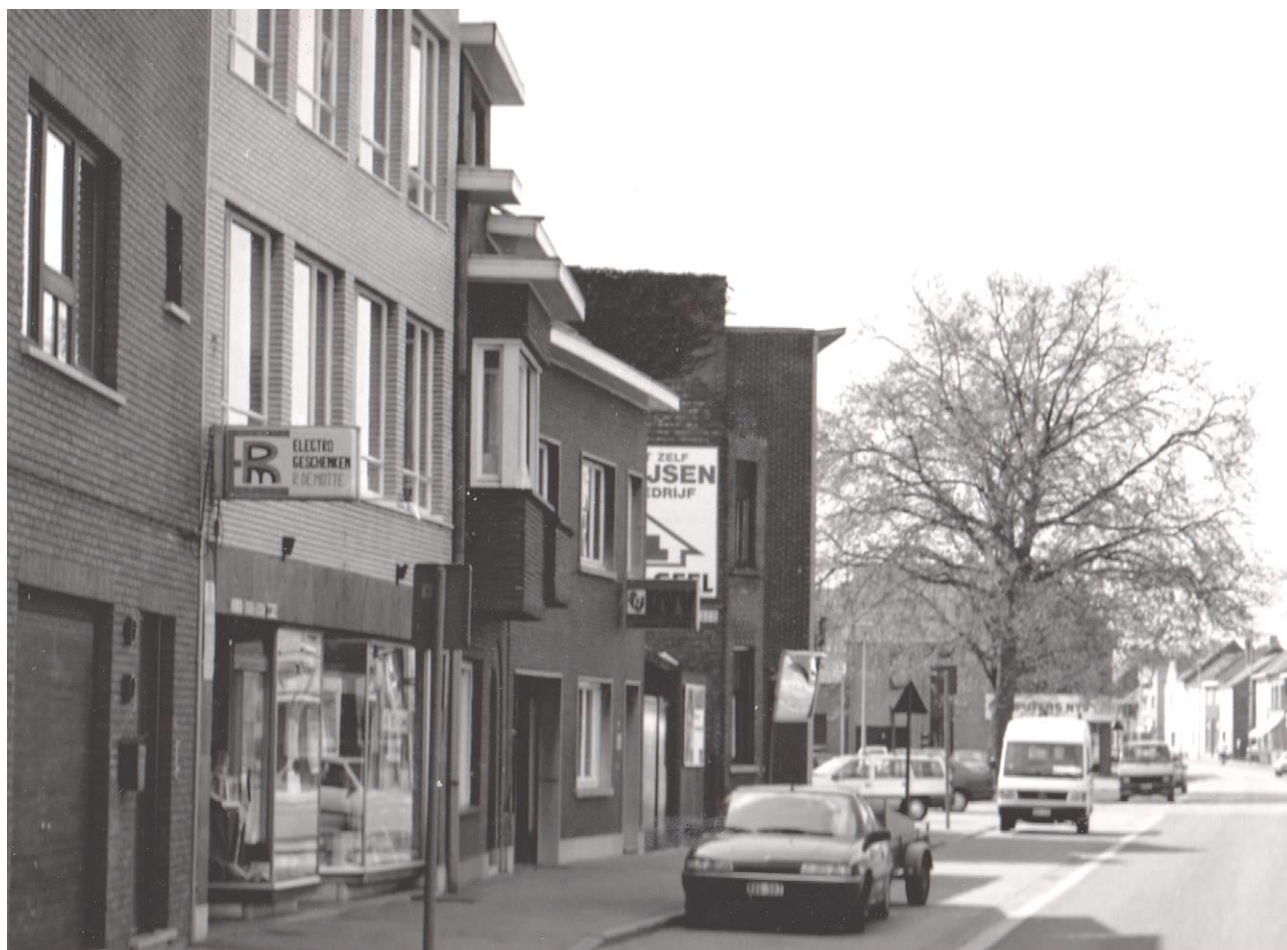
De winkel: Electro – geschenken – R. De Motte