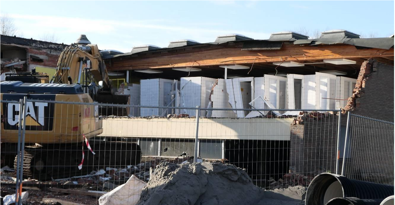
Adieu kleedhokjes van het oude binnenzwembad