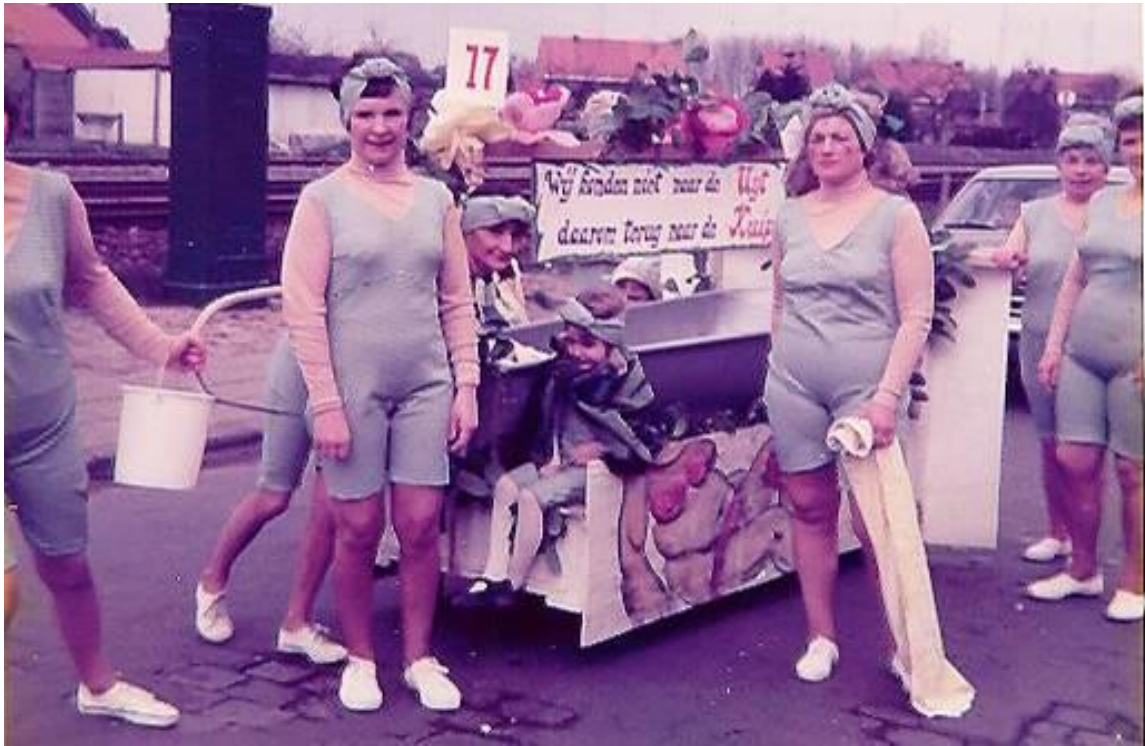
De tekeningen en de opschriften waren van Jos van 't Engels Huis.