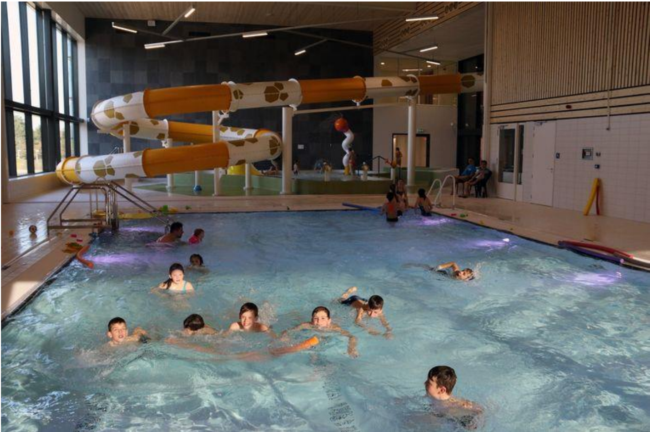
Het instructiebad met de glijbaan (Peter Vanderveken)

De opening van het binnenbad wil niet zeggen dat de werken volledig achter de rug zijn. In maart wordt gestart met de vernieuwing van het buitenbad van 50 meter. Het buitenbad opent in juni. Op de plaats van het oude binnenbad wordt nog een fitness gebouwd.