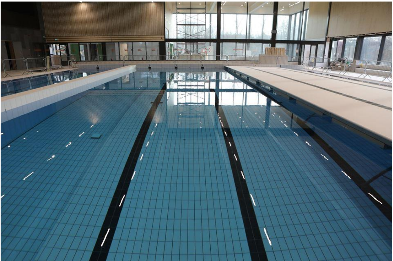
Lang leve het nieuwe binnenzwembad.