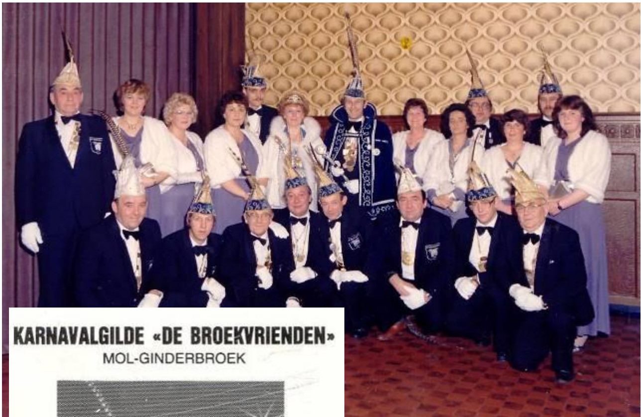
KARNAVALGILDE «DE BROEKVRIENDEN» MOL-GINDERBROEK