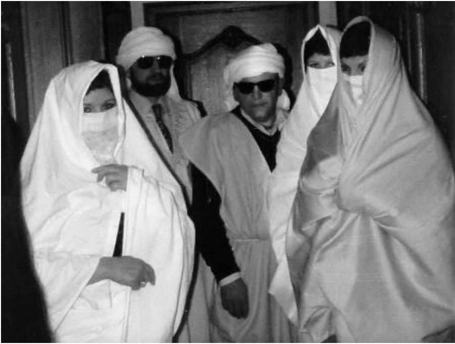
De moslimwereld tijdens het prinsenbal

Naast hun eigen bal gingen de carnavalsvrienden ook naar dat van hun bevriende carnavalsverenigingen. De prins en zijn gevolg hadden het niet alleen druk tijdens de carnavalsdagen, maar heel het jaar wachtten hen dans- en drinkavonden, verkiezingen of optochten. Ja, men moest wel een pintje kunnen verzetten.