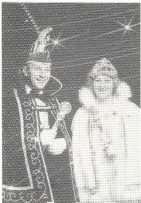
PRINS WALTER I - PRINSES LYDIE I - 1982-