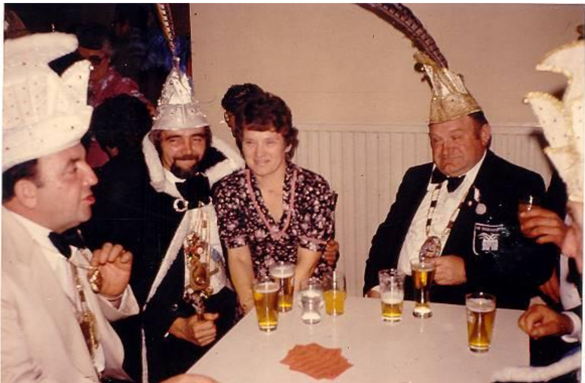
1976 – Carnavalpret bij de Draken te Lommel

Naast hun eigen bal gingen de carnavalsvrienden ook naar dat van hun bevriende carnavalsverenigingen. De prins en zijn gevolg hadden het niet alleen druk tijdens de carnavalsdagen, maar heel het jaar wachtten hen dans- en drinkavonden, verkiezingen of optochten. Ja, men moest wel een pintje kunnen verzetten.