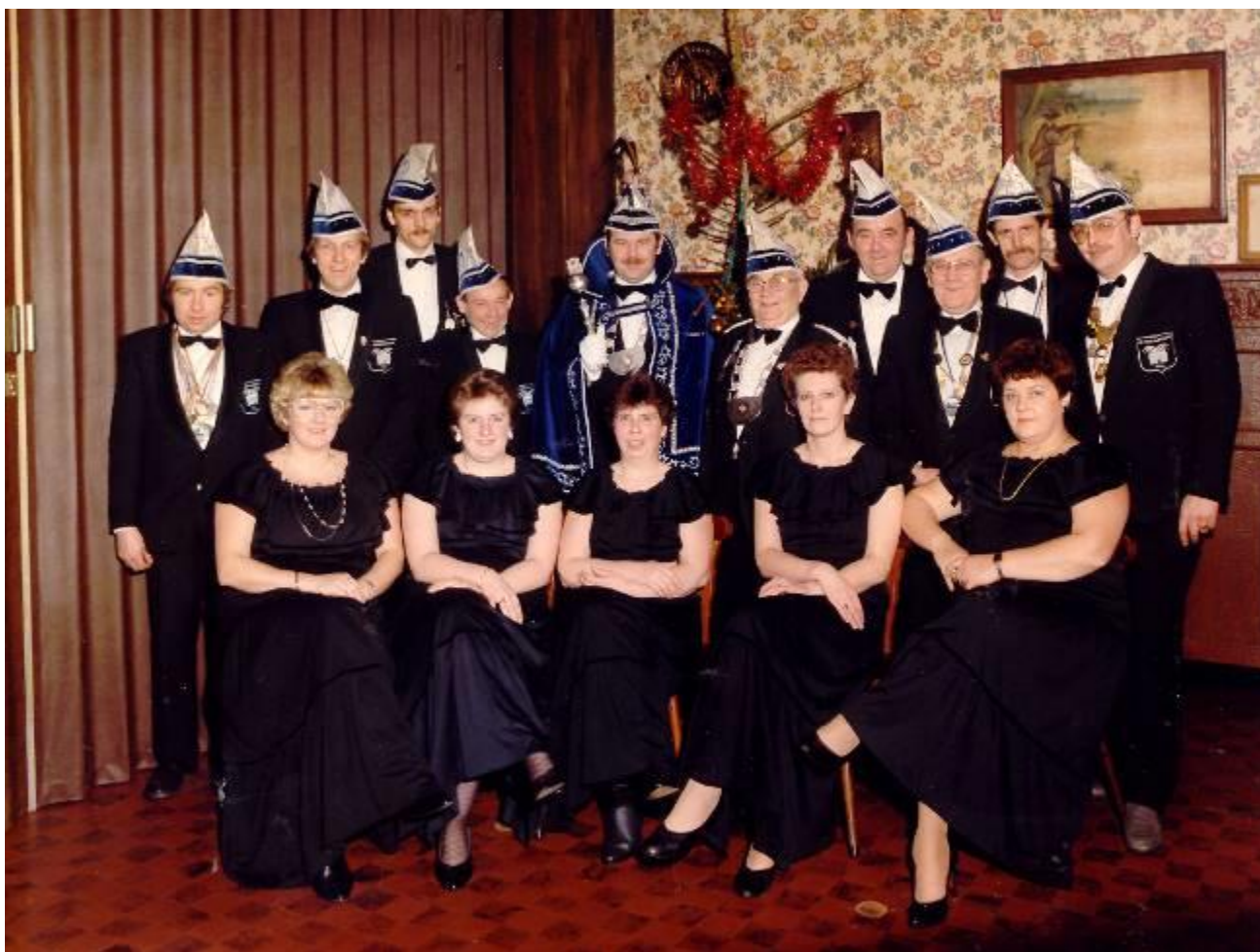
Prins Aloïs 1

Toe de carnavalstoet van de Molse Soepweikers rond 1885 ter ziele was gegaan, stond de Amerikaanse slee van de Broekvrienden nog enkele jaren naast het station te verroesten. De wagen werd het symbool van de vergane carnavalsglorie.