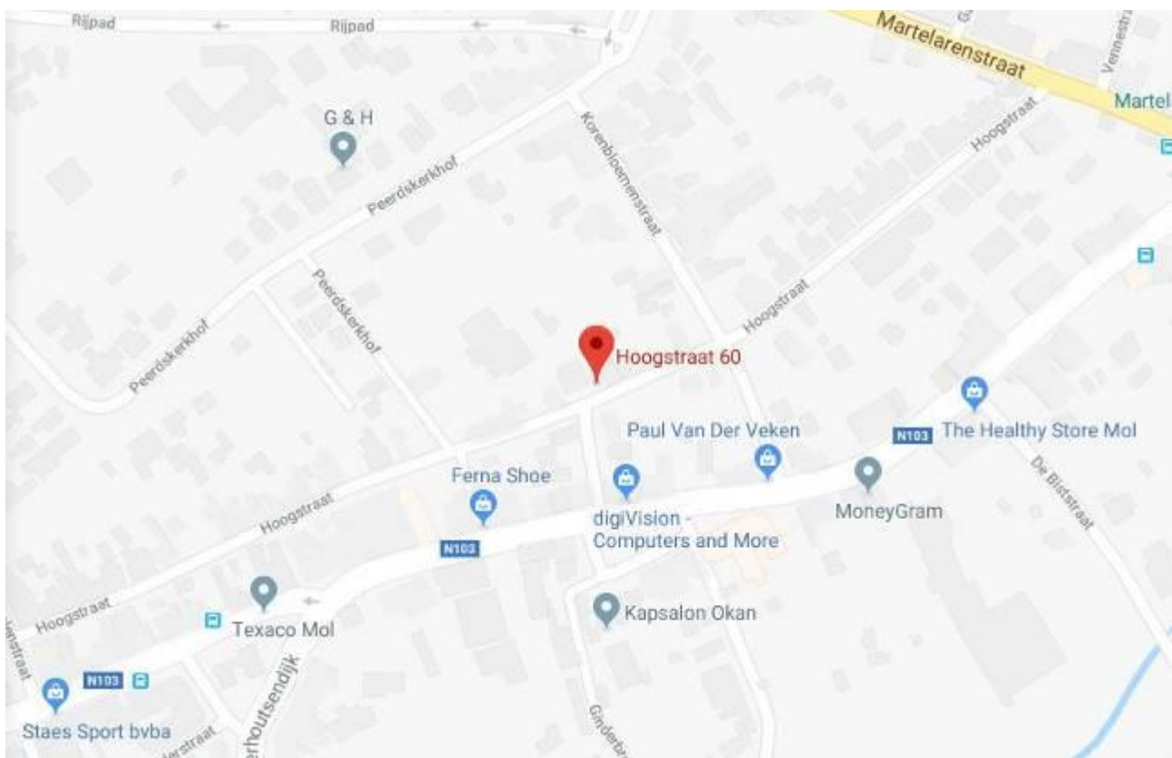
Hoogstraat 60, Mol