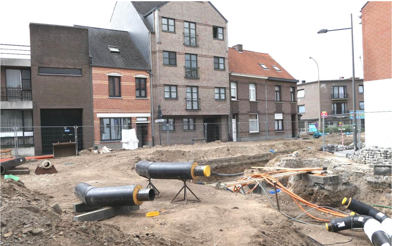
Hoek Martelarenstraat en Nieuwstraat