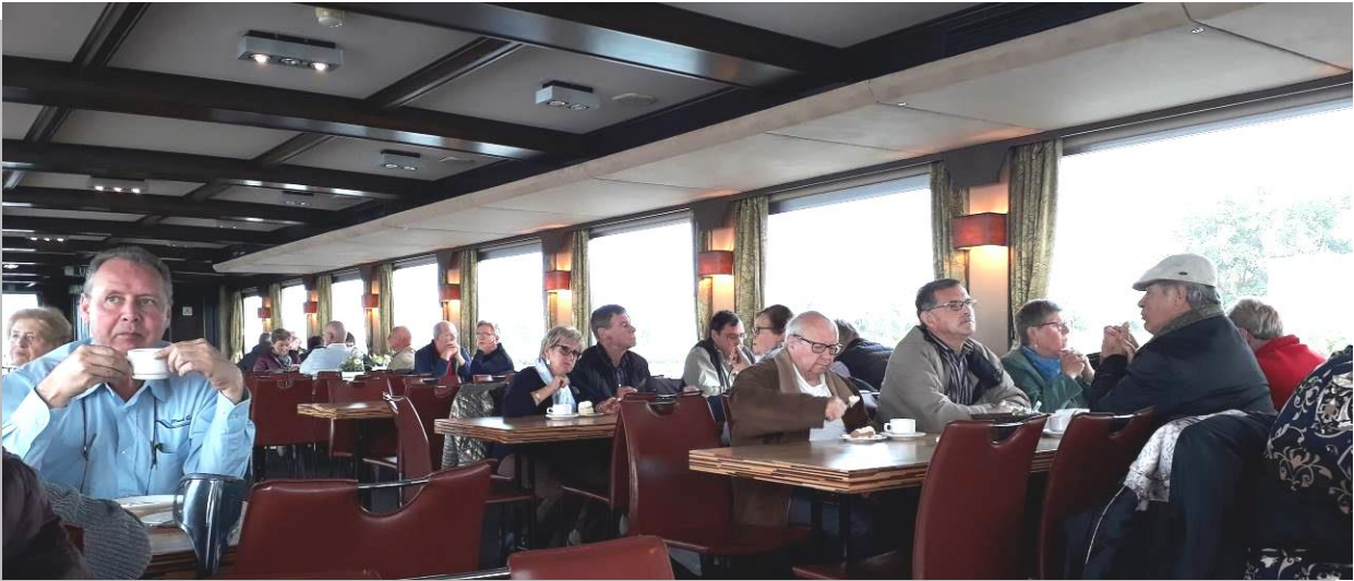
De rondvaart in het natuurgebied Biesbosch met een kopje koffie en gebak.