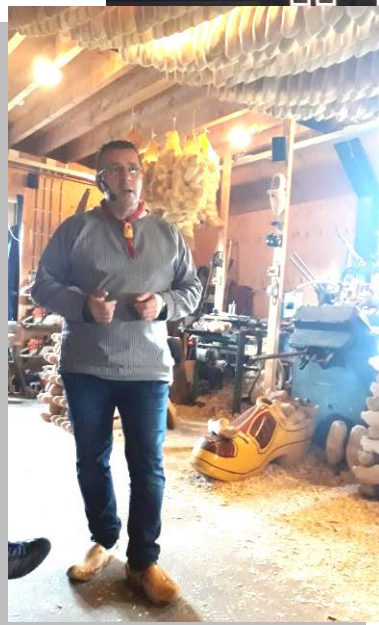
Bezoek aan de klompenmakerij Den Dekker.