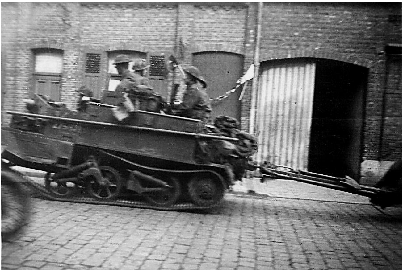
Een pantservoertuig Bren Carrier met een zes koppige bemanning, een kanon voorttrekkend.