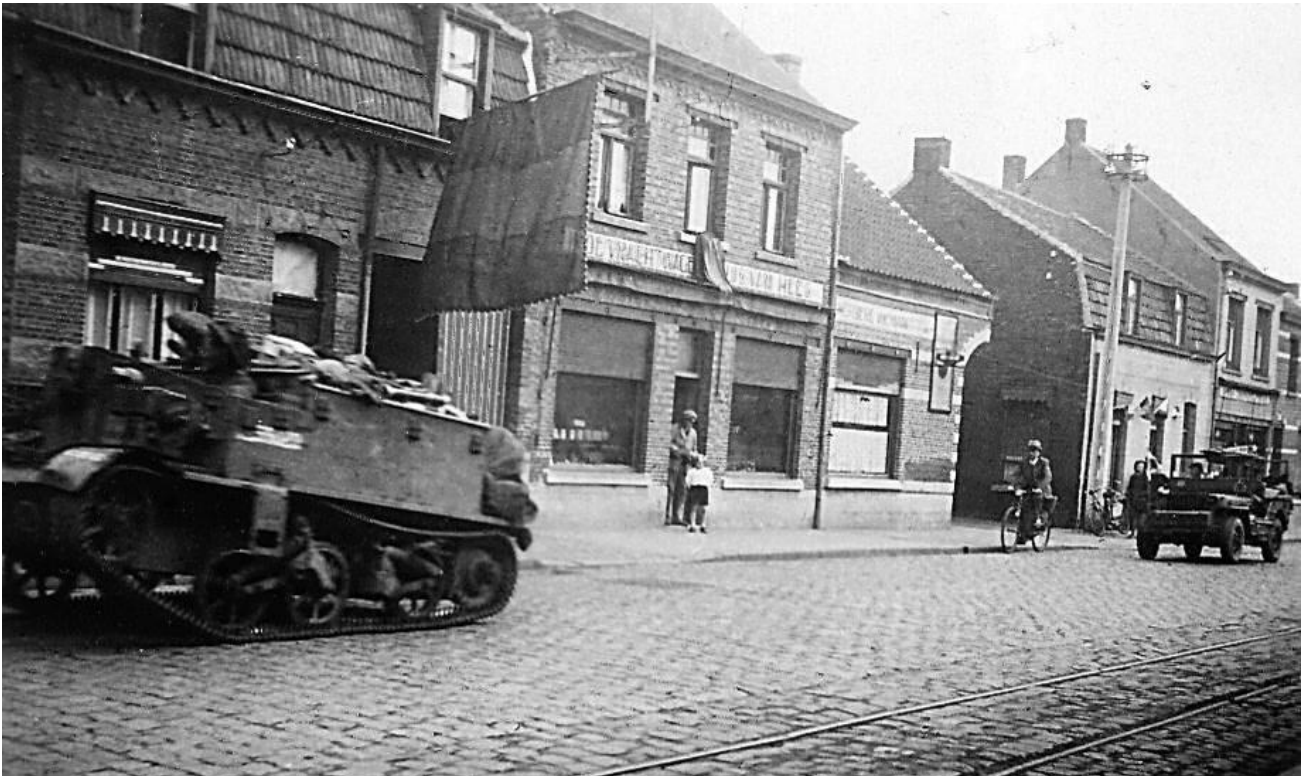
Nog september 1944 – Geallieerde voertuigen doorkruisen de wijk. Aan de gevels hangen nog de Belgische driekleuren van bij de bevrijding.