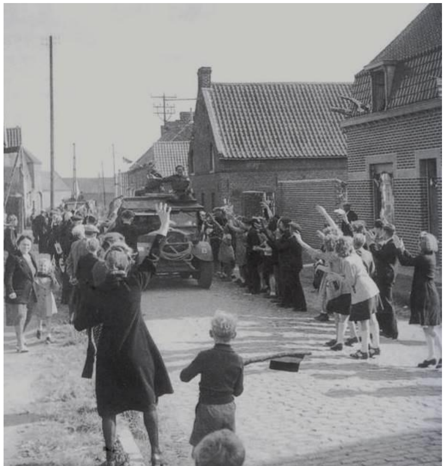
3 september 1944 – Het Amerikaanse leger en de Belgische Brigade Piron steken te Rongy de grens van Frankrijk met België over.

De geallieerde troepen die België begin september binnenvielen, hadden maar ruim een week nodig om het grootste deel van het land van de Duitse bezetting te bevrijden.