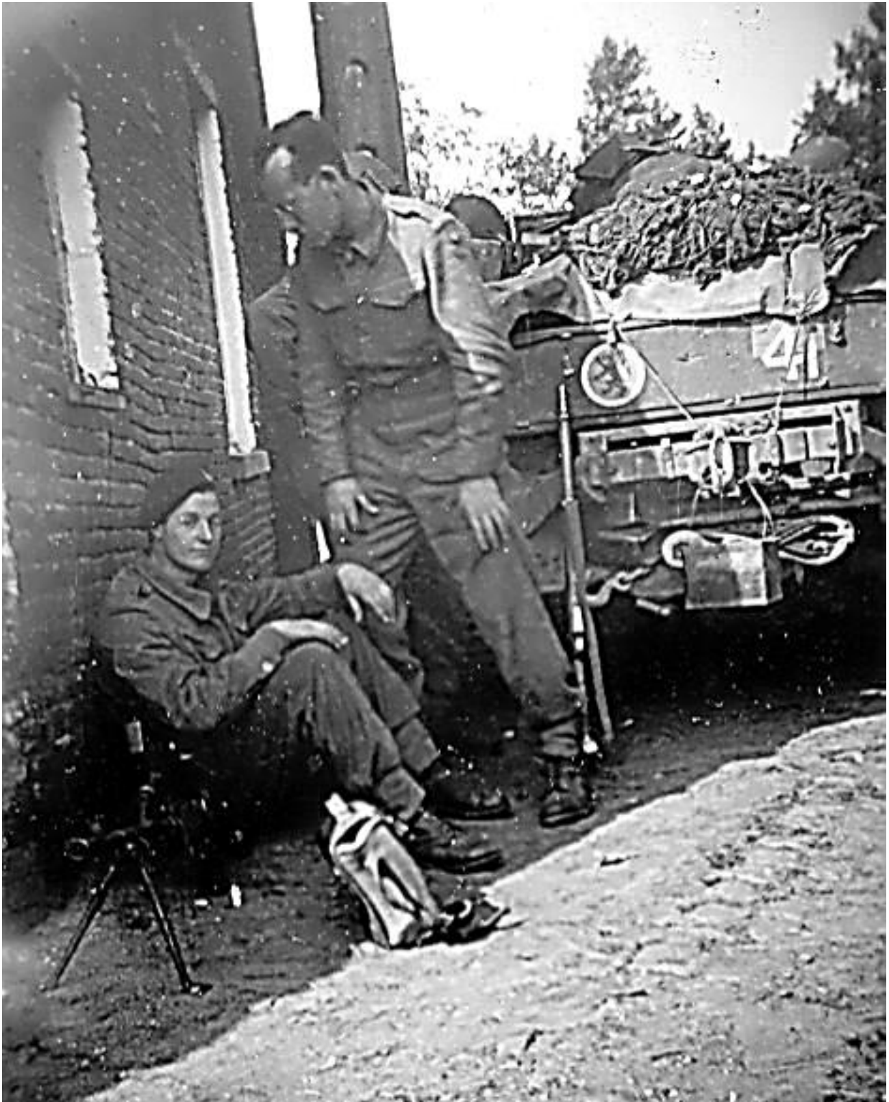
13 september 1944 - Bij het binnentrekken van Ginderbroek zocht de eerste patrouille een zijstraat op. Het was de Polderstraat. Ze stapten uit, legden hun bepakking af en pakten hun noodrantsoenen uit, maar steeds met het geweer in de aanslag om bij het minste onraad te kunnen reageren.