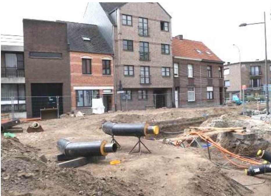
Hoek Martelarenstraat- Nieuwstraat