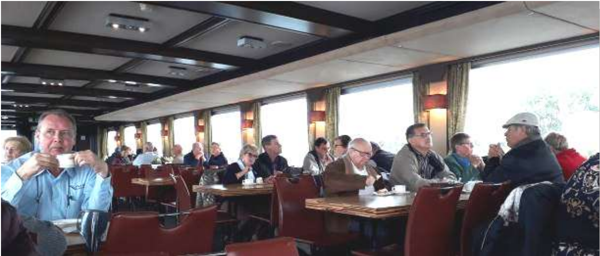
De rondvaart in het natuurgebied Biesbosch met een kopje koffie en gebak.