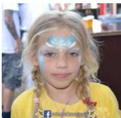
Kindergrime tijdens avondmarkt