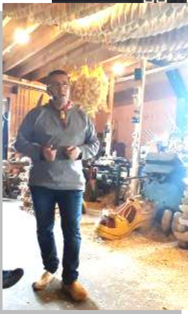
Bezoek aan de klompenmakerij Den Dekker.