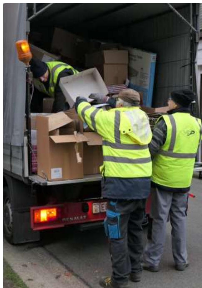
De ploeg met de gele vestjes en een zwaailicht op de wagen.