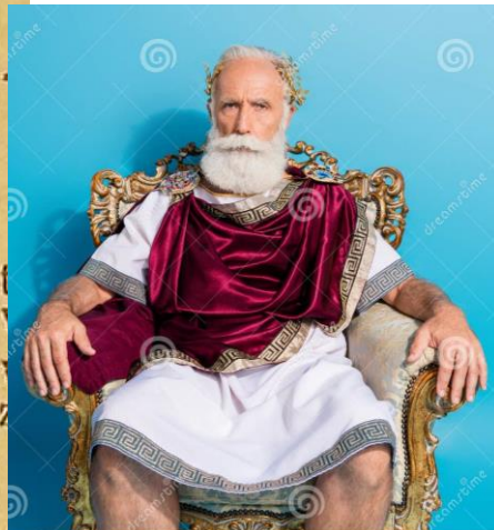
Griekse god Profie